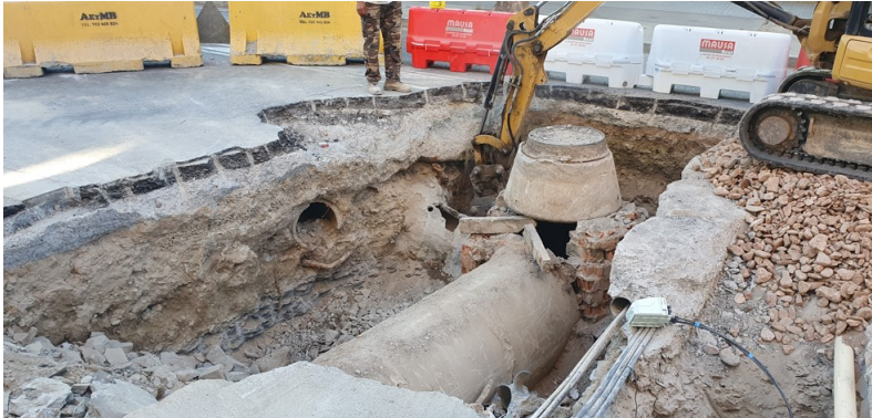
Imatge de la connexió del clavegueram del carrer Nou a la carretera de Roda on es pot observar que només hi ha una sola claveguera i que la roca es troba a uns 70 cm de profunditat.

Unitat tramitadora: Unitat Administració Secretaria Codi document: ASC18I029L